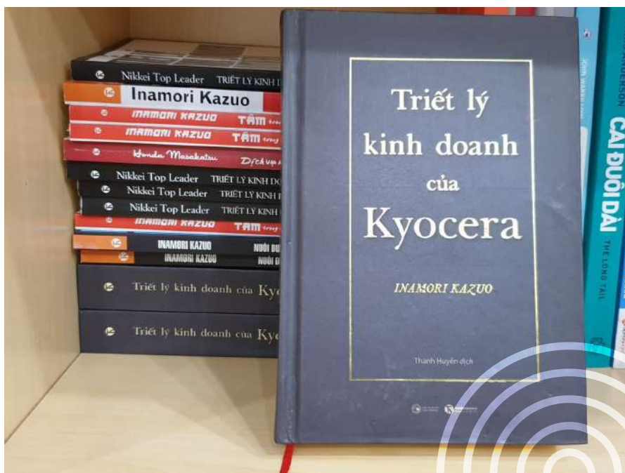
Sách “triết lí”, hay sách “nguyên lí”

Ví dụ, nhà quản trị cầm sách “Triết lí kinh doanh Kyocera” lên và đọc được nguyên lí gói trong công thức mà tác giả gọi là Công thức cuộc đời. Công thức được viết ra: Thành tựu = Tư duy * Nhiệt tình * Năng lực; với giá trị của từng tham số Tư duy từ -100 đến 100, Nhiệt tình từ 0-100; Năng lực từ 0-100. Người đọc không dễ gì vận dụng được ngay. Để vận dụng được, nhà quản trị buộc phải nghĩ ra tiếp một thang đo thế nào là tư duy -100 điểm, khi nào thì tư duy được đánh giá 10 điểm, khi nào thì tư duy được đánh giá 100 điểm, vì sao? Tương tự như thế với Nhiệt tình, và Năng lực. Như thế là từ nguyên lí, nhà quản trị đã xây dựng được thêm một bộ quy tắc để áp dụng nguyên lí này vào thực tiễn. Xong rồi nhà quản trị lại phải tiếp tục đặt ra tình huống khi nào thì sử dụng công thức kia: dùng cho mình hay cho nhân viên đang làm việc, hay nhân viên tiềm năng đang tìm việc ở công ty, hay nhân viên chuẩn bị được thăng chức. Từng tình huống như thế sẽ đòi hỏi phải đánh giá lại nhân sự có sử dụng công thức kia. Đó chính là cách “đọc” một nguyên lí. Nó bao gồm việc nắm bắt nguyên lí đó, hiểu sâu nó để đề xuất ra được một loạt “quy tắc”, và rồi đưa vào các “tình huống” vận dụng công thức đó.